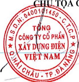
TRẦN QUANG CÂN